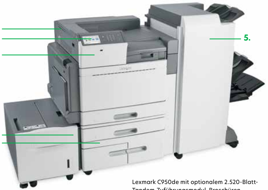
Lexmark C950de mit optionalem 2.520-Blatt-Tandem-Zuführungsmodul, Broschüren-Finisher und 2.000-Blatt-Zuführung für hohe Kapazität.