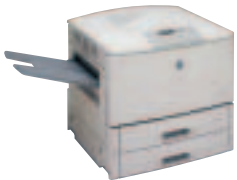
HP LaserJet 9000N