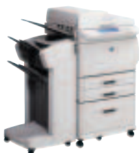
HP LaserJet 9000MFP mit optionalem Ausgabefach mit Hefteinrichtung

Der HP LaserJet 9000 gehört zu einer neuen Generation von internetfähigen Druckern für Abteilungen mit hohem Druckvolumen.