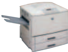
HP LaserJet 9000

Der HP LaserJet 9000 ist ein außerordentlich vielseitiger, extrem schneller Schwarzweiß-Netzwerkdrucker . Er verbindet hohe Geschwindigkeit, Bedienerfreundlichkeit und Flexibilität und wird so einer Vielzahl von Anforderungen gerecht . Kurz gesagt: Der HP LaserJet 9000 bietet die Leistung und den Komfort, den man sich schon immer gewünscht hat.