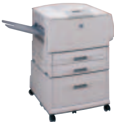
HP LaserJet 9000DN mit optionaler 2000 Blatt-Papierzuführung