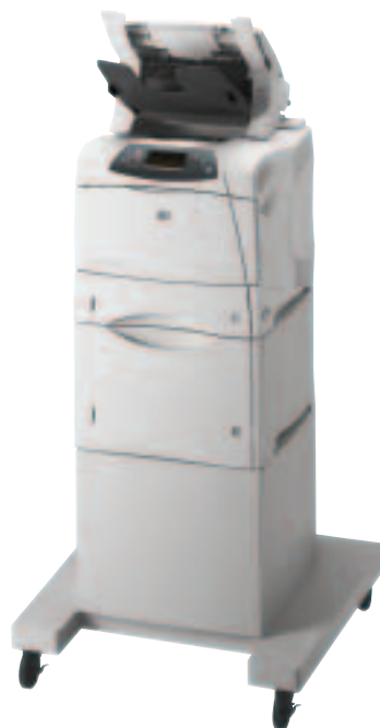
HP LaserJet 4200/4300 mit optionalem Zubehör