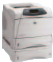
HP LaserJet 4200TN und HP LaserJet 4300TN