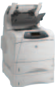
HP LaserJet 4200DTNSL und HP LaserJet 4300DTNSL

Die Drucker der HP LaserJet 4200 und HP LaserJet 4300 Serie bieten professionellen Anwendern sowie kleinen, mittleren und großen Unternehmen die zuverlässige Leistungsfähigkeit eines HP LaserJets, einmalige Vielseitigkeit und bedienerfreundliche Lösungen zur Bewältigung der hohen Druckvolumen in Arbeitsgruppen mit 5-15 Anwendern.