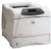
HP LaserJet 4200/N und HP LaserJet 4300/N

Mit ihrer hohen Druckleistung und Druckqualität übertrifft die HP LaserJet 4200/4300 Serie die Erwartungen der Anwender. Die intelligenten, vielseitigen und zuverlässigen Schwarzweißdrucker bieten eine Vielzahl bedienerfreundlicher Funktionen für den Einsatz in Arbeitsgruppen und die einfache Verwaltung der Drucker im Netzwerk.