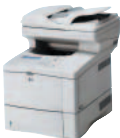
HP LaserJet 4100MFP